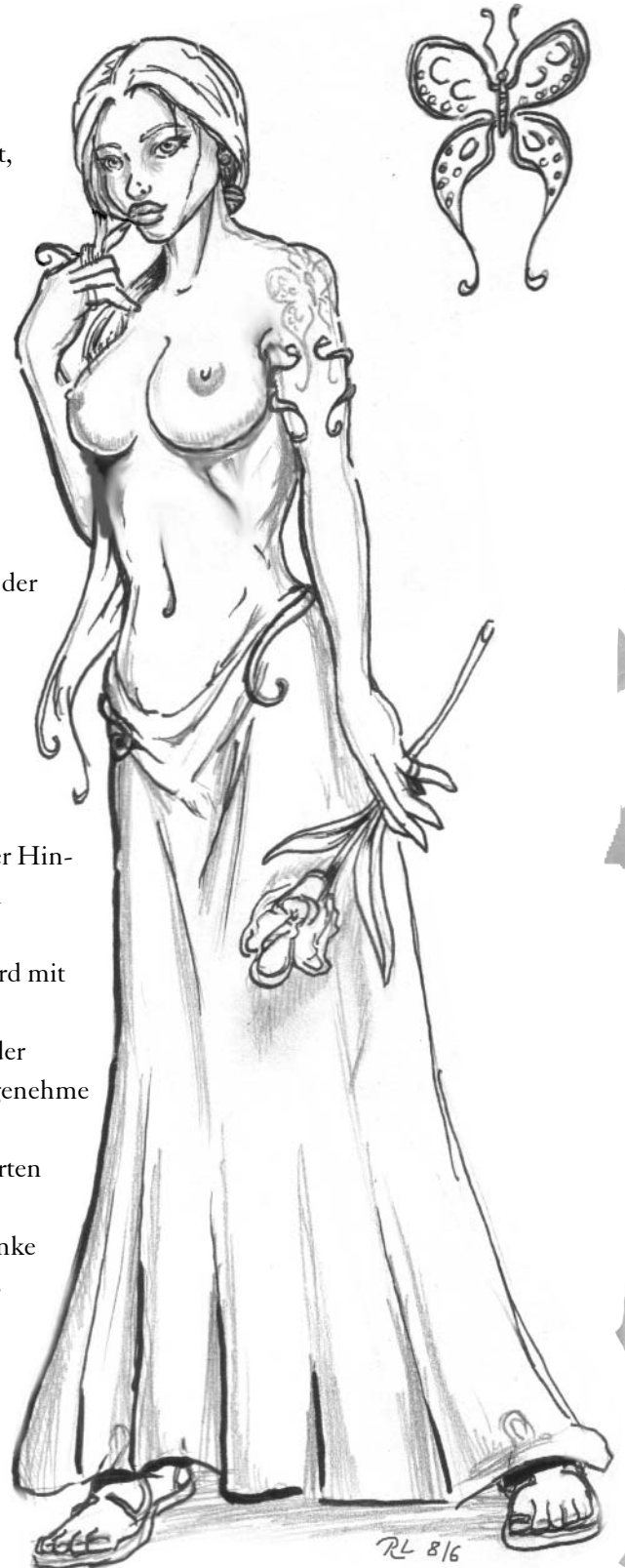
Zeichnung: Raiapriesterin, René Littek, 2006

Stärkstes Argument: Ein Liebender schreckt nicht einmal den Tod, um mit seiner Liebsten wieder vereint zu sein.